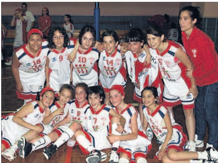
Felicitem l'equip mini del CB Lleida, que es va proclamar campió de Lliga Femenina de Bàsquet el passat dia 15 de maig. Enhorabona i endavant!