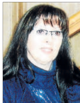
Felicitats pel teu aniversari, i que passis un bon dia! Els teus amics.