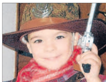
Per al nen més guapo, felicitats pel seu aniversari. Dels seus oncles.