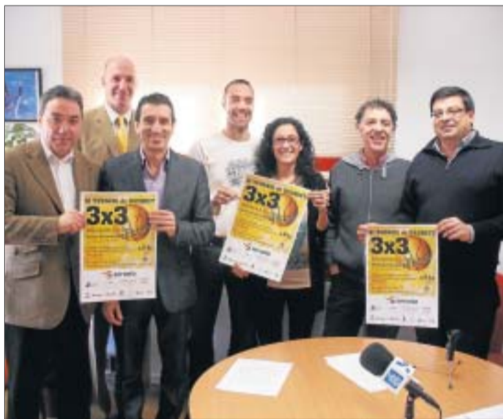
El torneo y la colaboración entre ambos clubes se presentó ayer.