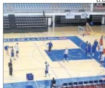
La plantilla, ayer en La Palma.