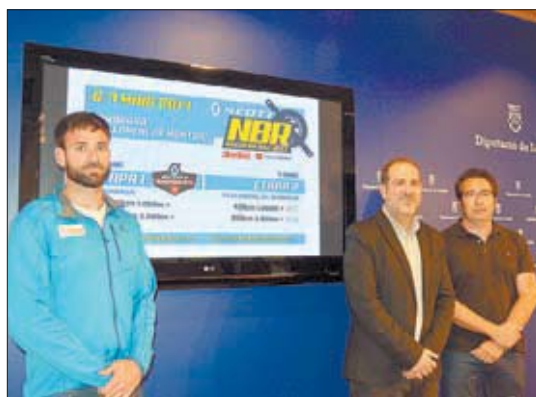
La prueba tiene tres modalidades

Los participantes tienen diferentes opciones para disfrutar